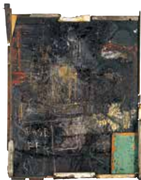
大竹伸朗 漁船窓Ⅰ 1986-88 Oil, oil stick, plaster, wood (reclaimed ship timber) on canvas 255x200x18cm © Shinro Ohtake Courtesy of Take Ninagawa

ドを結成。街中で興味を惹いた音や工事現場の騒音、ラジオのノイズなどを録音して、8チャンネルのミキサーに楽器の音を重ね、レコード盤を自主制作している。