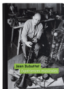
Jean Dubuffet Experiences Musicales Fondation Dubuffet 2006年(BOOK+CD) 232頁のブックレットは全編フランス語だが、デュビュッフェの楽器コレクションや演奏写真を収める。付属のCDにはアン・リミショーやアスガー・ヨルンとの共演を含む7曲が収められている。

1960年、芸術家集団「CoBrA」のアスガー・ヨルンと実験音楽を試み、レコードを発表。速度を変えたテープの音、唸るような声、子供が楽器で遊ぶように、リズムや調性からも解放された自由な音響空間が繰り広げられる。「宇宙のざわめきに、その野蛮なノイズを取り返すこと」と語った、音楽版「生の芸術」＝「ミュージック・ブリュット」は、今日のノイズ・ミュージックの源流ともいえる。