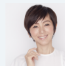
渡辺満里奈 Watanabe Marina (Vocal)