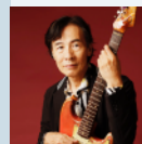
鈴木茂 Suzuki Shigeru (Guitar)